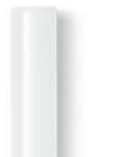
7 mm-es Cristal ragasztórúd

240 g EAN 4007841 006730 96 g EAN 4007841 006747