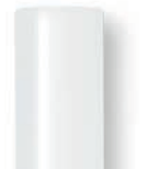
11 mm-es Cristal ragasztórúd

1000 g EAN 4007841 046910 500 g EAN 4007841 044930 250 g EAN 4007841 006761