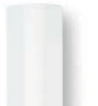
11 mm-es Ultra Power ragasztórúd

Rendkívül erős, univerzális melegra- gasztó. Tökéletes megoldás barká- csoláshoz.