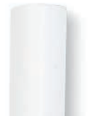
11 mm-es fehér ragasztórúd

Erős, univerzális melegragasztó. Tökéletes megoldás világos anyagok ragasztásához vagy javításhoz.