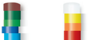
7 mm-es színes, vegyes ragasztórudak

240 g EAN 4007841 006594 96 g EAN 4007841 006624