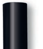
11 mm-es fekete ragasztórúd

1000 g EAN 4007841 006822 500 g EAN 4007841 048419 250 g EAN 4007841 006754