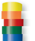
11 mm-es színes, vegyes ragasztórúd

Erős, univerzális melegragasztó. Tökéletes megoldás színes anyagok ragasztásához vagy színes feliratok felerősítéséhez.