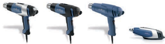
HL 2020 E