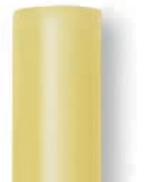
11 mm-es ragasztórúd fához

Speciális melegragasztó mindenféle fához.